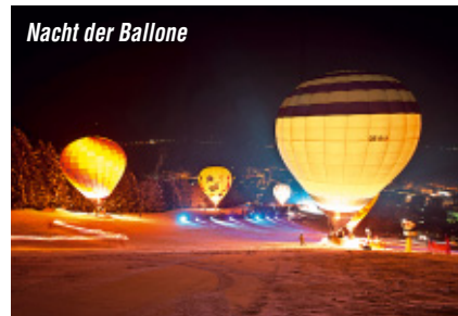
Nacht der Ballone

Es ist eines der beliebtesten Rennen der Region und es gehen Hobbysportler und Ambitionierte an den Start, um auf Tourenskiern den Berg hochzujagen.