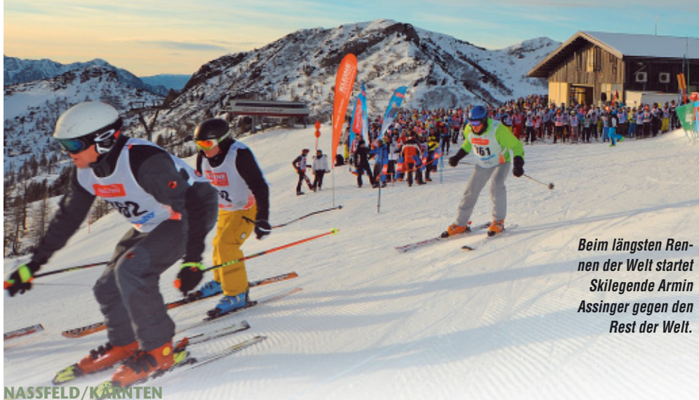
Beim längsten Rennen der Welt startet Skilegende Armin Assinger gegen den Rest der Welt.