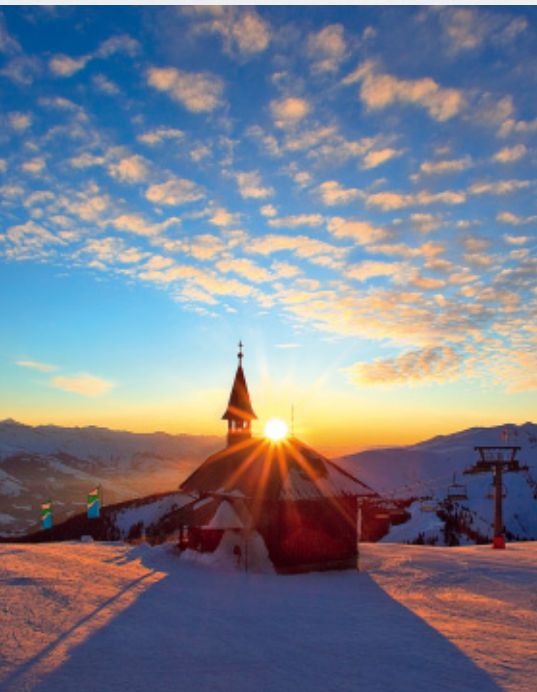
Die Elisabethkapelle auf der Schmittenhöhe ist nicht nur bei Sonnenuntergang ein reizvoller Anblick.