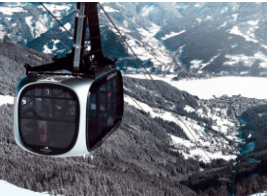
Die neue Seilbahn auf die Schmittenhöhe transportiert die Pistenfans bis auf 2.000 Meter Höhe.

Anlässe zum Feiern finden sich aber nicht nur beim Après-Ski. Irgendwo scheint immer irgendwie ein Fest oder Event stattzufinden – oft sogar auf den Campingplätzen selbst. Die Pinzgauer wissen, wie man den Winter zum Erlebnis macht. rec